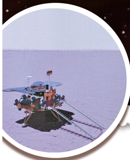
火星探测器着陆火星表面模拟图(5月15日摄)。

“天何所沓？十二焉分？日月安属？列星安陈？”两千多年前，诗人屈原仰望苍穹，发出“天问”。两千多年后，以屈原长诗命名的天问一号探测器在火星乌托邦平原南部预选着陆区，完成了一次教科书式的精准着陆，在火星上首次留下中国人的印迹，迈出了我国星际探测征程的重要一步。