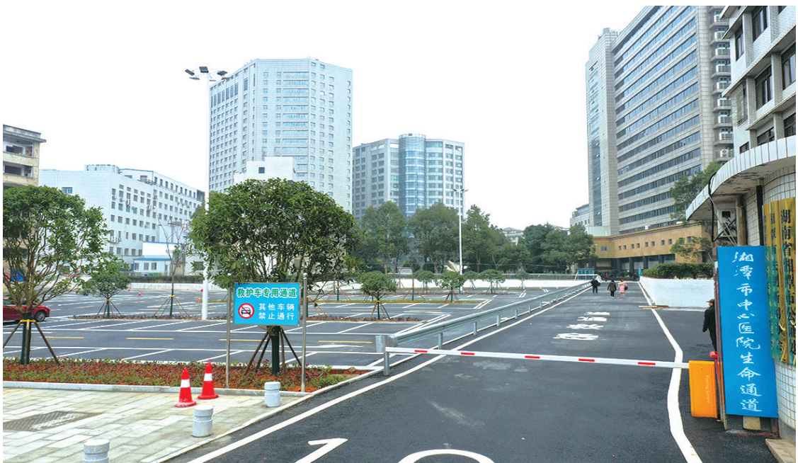
建设完成的生命通道。

湘潭市中心医院将汲取过往在急诊救治及危重症患者救治中的经验，协同各成员单位，切实把创伤救治联盟及相关医疗领域的发展成果转化为全市人民群众的健康福祉和获得感。