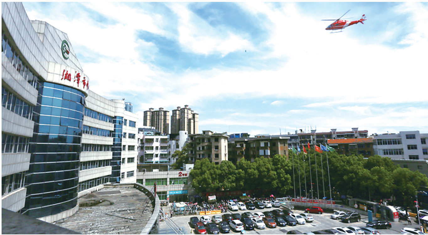
2018年6月27日，医院启动湘潭市首个航空医疗救援项目，搭建陆空互补立体医疗救援体系，为市民开辟了一条空中“生命走廊”。

湘潭市中心医院成为“直升机医疗救援网络保障单位”之后，标志着全市急救医疗服务体系迈上新台阶，形成“空地结合”的院前急救网络，为抢救患者增添了新的“生命通道”。