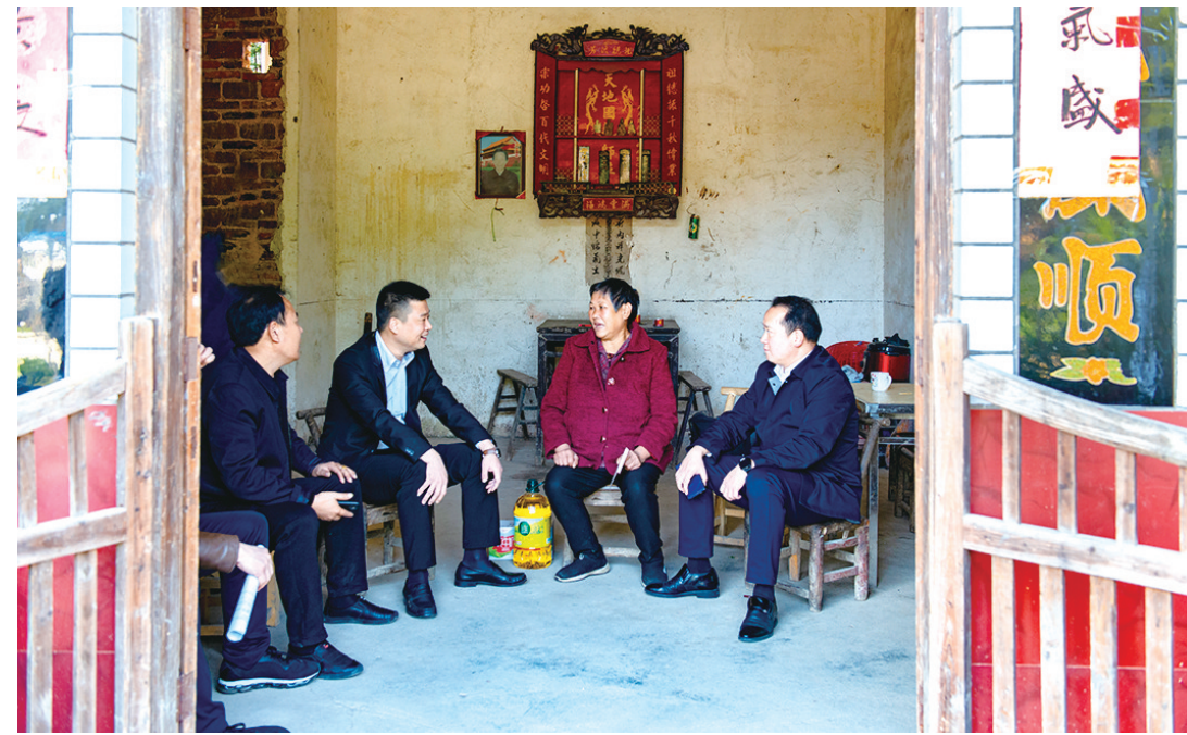
产业集团党员干部走访慰问原建档立卡贫困户。

筑面积约5000平方米，包括学员培训中心、学员活动中心、劳动实践基地三个部分；现场教学点由毛泽东调查研究展馆、银田寺(毛泽东南下农民运动考察、中共银田特别支部、湘潭县第一区农民协会旧址)、韶山灌区、毛家长庆和米谷行、林彪烈士墓等组成；红色民宿由风景秀丽、空气清新韶河河街100栋民居改造而成。“我们将充分整合这些资源，通过开设访谈式、体验式、情景式等现场教学课程，让学员身临其境，在参与、互动、体验中接受党史学习教育。”产业集团相关负责人介绍，为了让学员们接受不一样的党史学习教育，基地贯彻同吃、同住、同劳动的群众路线教育理念，以红色教育培训、研学实践、红色民宿为载体，以村级增收、农民稳收、基地增收为路径，用好红色资源，传承红色基因，深化作风建设，共促乡村振兴，真正让党员干部受教育、群众得实惠，打造“没有围墙党校式”的新型党性教育基地、廉政教育基地、研学实践基地。如今，兴邦红培已经成为推动我市红培产业发展的一支重要力量，获批为湘潭市党史教育现场教学基地，成为湖南省文旅厅批复的首批参与接待党政机关和企事业单位开展红色教育培训机构。近期，已接待研学游团队近2000人次，接待红培团队2000余人次。银田基地展厅计划与韶山合作打造成为全国毛泽东调查研究专题陈列馆。