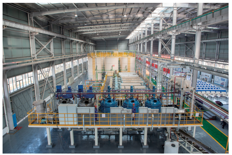
新建投产的海泡石生产线。