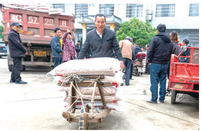
原建档立卡贫困户喜领产业集团提供的化肥和农药等物资。