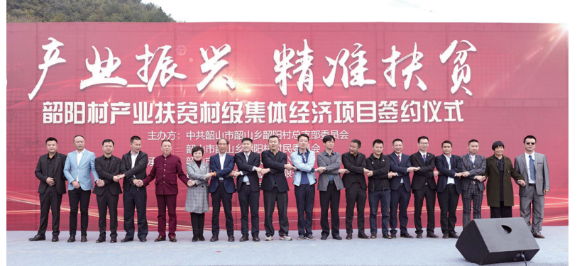
产业集团帮扶韶阳村大力发展扶贫产业。