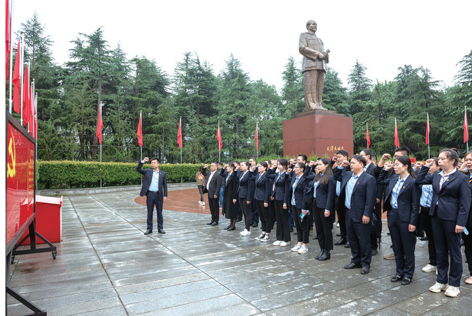
产业集团党员干部重温入党誓词。

湘潭是伟人故里、红色圣地，这里走出了一代伟人毛泽东以及彭德怀、黄公略、陈赓、谭政等将帅，拥有毛泽东同志故居、彭德怀同志故居等伟人名人故居以及大量的革命历史遗址留存，红色资源非常丰富。为了用好活用自身资源，把红色资源利用好，把红色基因发扬好，把红色基因传承好，产业集团顺势而为，成立韶山市兴邦红色教育培训中心(以下简称“兴邦红培”)，取“实干兴邦”之意，助力全市红色教育培训产业发展。兴邦红培由产业集团与市委党校联合兴办，面向全国党员干部开展红色文化教育培训。兴邦红培机构，是产业集团把脉市场走向，发接湘潭优势，立足自身实际，实现转型发展的一次生动实践。借助市委党校强大的理论研发资源，公司拥有湖南省委党校、中南大学、湖南大学、湘潭大学、湖南师范大学等20多个单位的100多名专家组成的师资队伍，研发了300多堂专题课程，可以向学员们提供点单式、定制式的服务，量身定做红色教育培训课程。课后，兴邦红培推行反馈制，根据学员意见提升优化课程设置，深受欢迎，获得市场认可，业务供不应求。与此同时，产业集团进一步整合优势资源，大力建设韶山红色党性教育基地，打造红色品牌。目前，韶山银河党性教育基地(筹)由“教育培训中心+现场教学点+红色民宿”组成，即“1+N+100”。其中，红色教育培训中心占地36亩，建