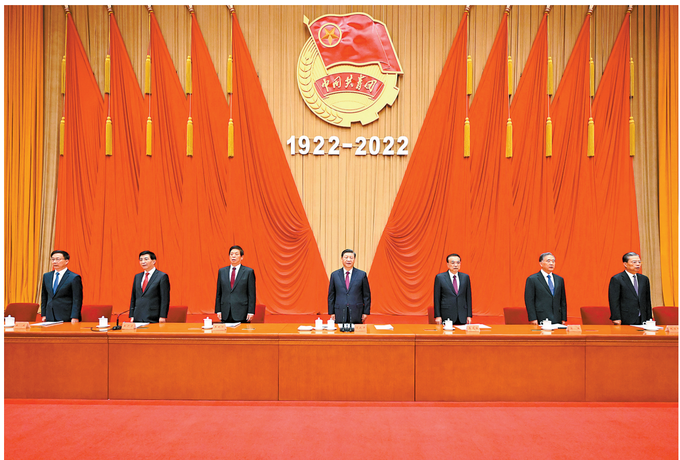
5月10日,庆祝中国共产主义青年团成立100周年大会在北京人民大会堂隆重举行。中共中央总书记、国家主席、中央军委主席习近平在大会上发表重要讲话。