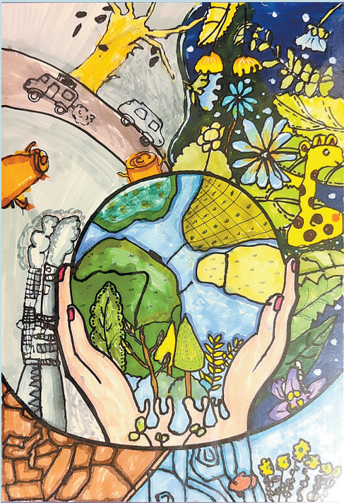
本报小记者 湘潭县天易贵竹学校2206班 谭楷迪