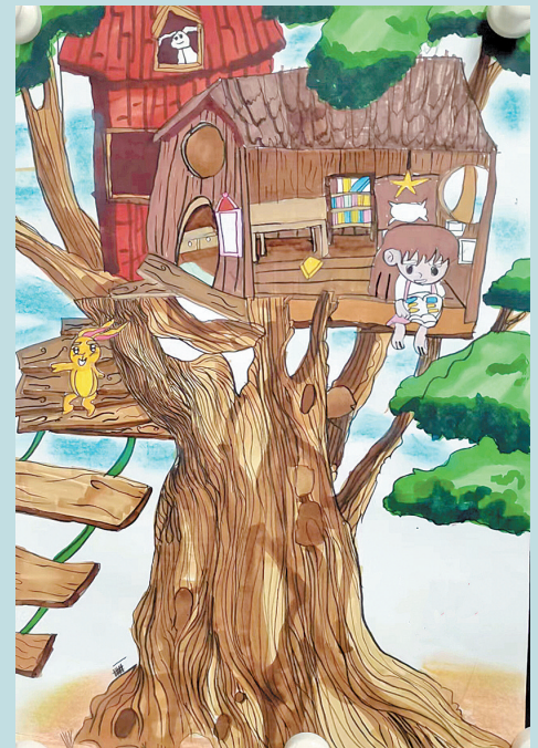
本报小记者 湘潭县天易贵竹学校2010班 杨子浩