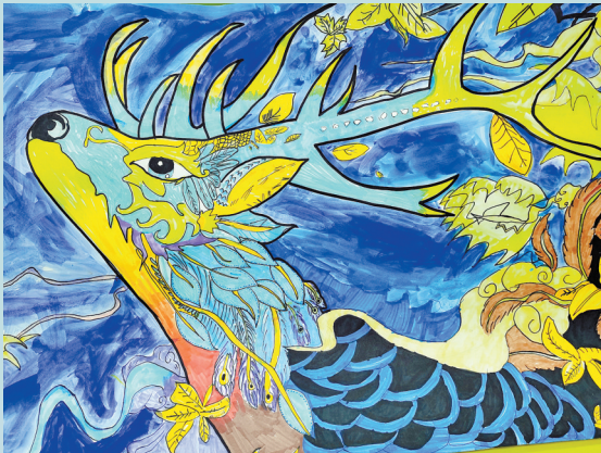
本报小记者 湘潭县烟塘中心小学2004班 刘羊彤