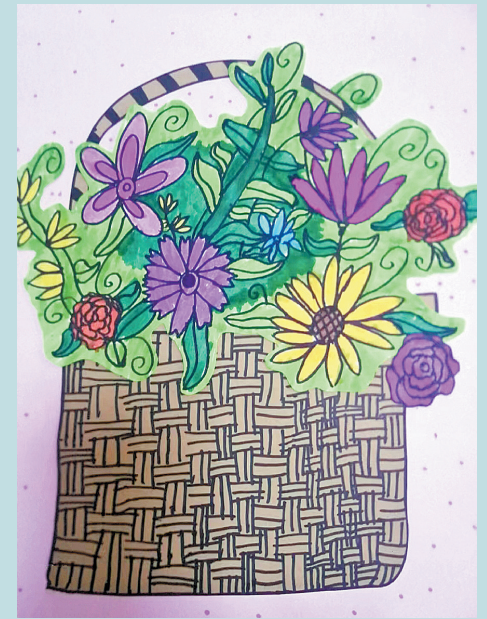
本报小记者 湘潭县赵家洲中心小学2002班 李晨非