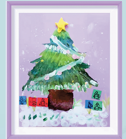
本报小记者 湘潭县百花小学2202班 罗晗语