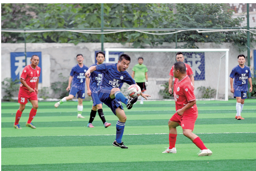
比赛场上,球员们积极拼抢。

本报讯(记者 熊婷 通讯员 肖业)8月26日晚,历经21天7轮21场激烈角逐。2023年“全民健身 健康中国”全国