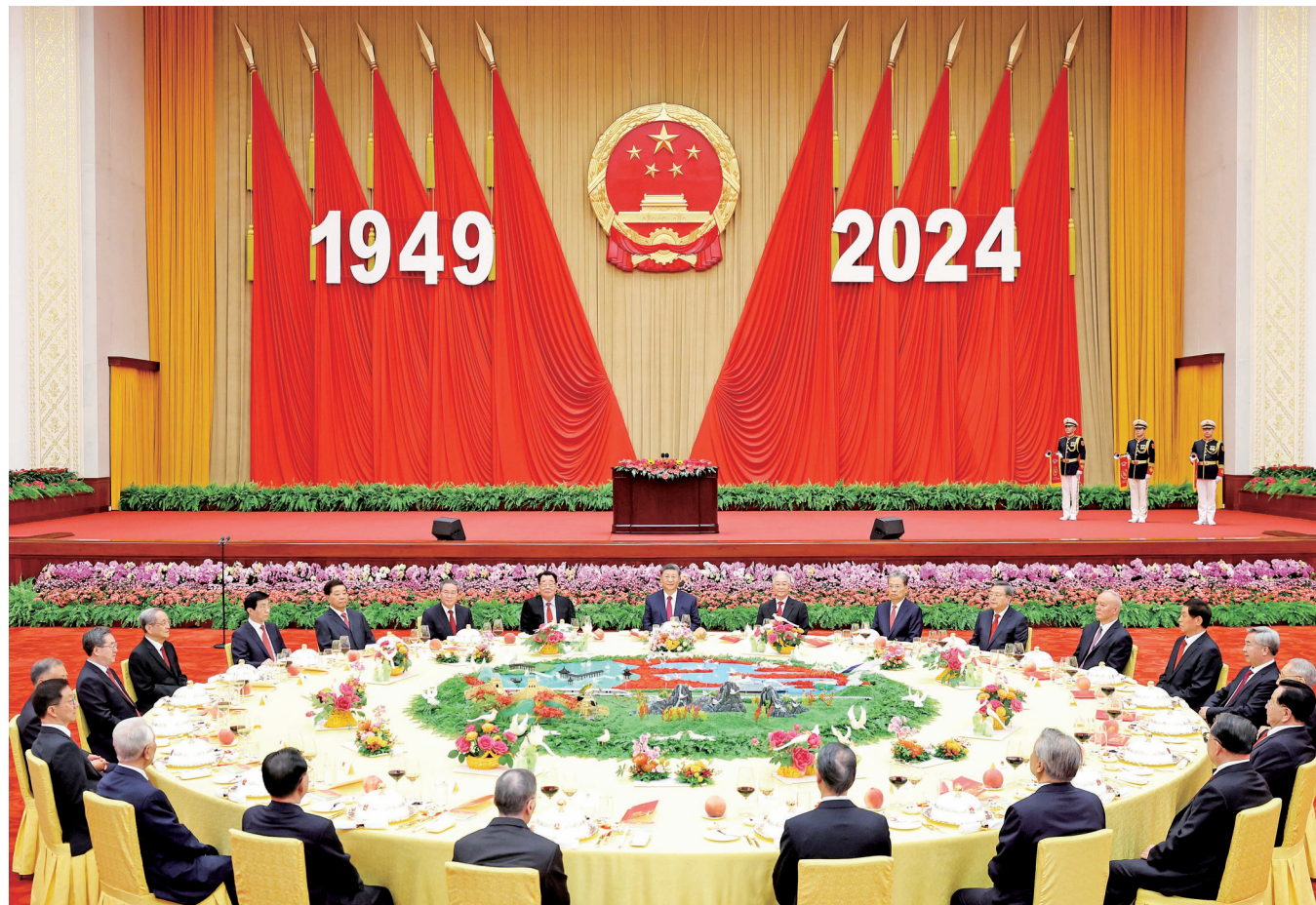
9月30日晚,庆祝中华人民共和国成立75周年招待会在北京人民大会堂隆重举行。中共中央总书记、国家主席、中央军委主席习近平出席招待会并发表重要讲话。