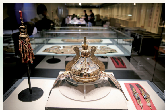
曾国藩穿过的锦甲。

他还是东山书院的主要创办者，是湘军将领致力于教育最成功的典范。当年，刘锦棠刚从新疆回到家乡时，湘乡的士绅正在酝酿建立一所新的书院，他闻讯后，带头募捐，他自己捐款2000两白银，还积极动员自己的部下捐献。在他的倡导下，东山书院很快建立起来，也就是现在东山学校的前身。该院首开湖南学校教育西方科学文化之先河，特别重视新式教育，后来，培养了毛泽东、陈唐、谭政、毛泽覃等领袖人物和革命家、军事家。可以这样说，刘锦棠倡导捐建东山书院，不仅推动了湘乡文化教育的发展，而且其遗泽还惠及中国革命。